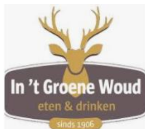
Restaurant in 't Groene Woud