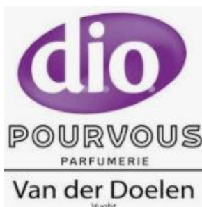
Parfumerie van der Doelen