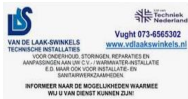
Technische Installaties van de Laak