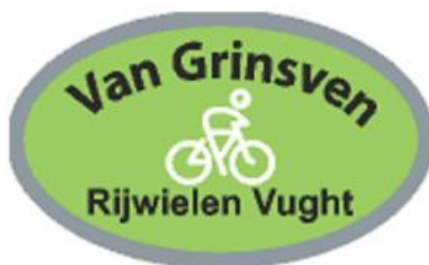
Van Grinsven Extrabikes